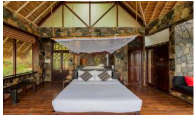
HOTEL CINNAMON CITADEL KANDY 4* Sup.