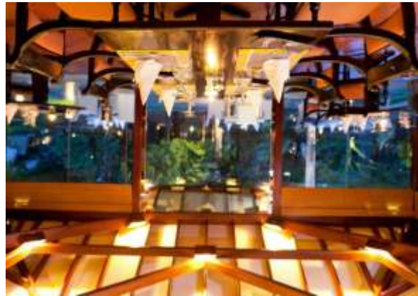
HOTEL UGA ULAGALLA 5*.