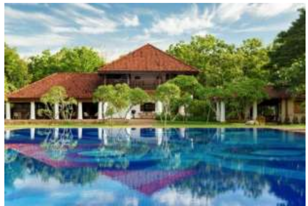
HOTEL MOVENPICK 5*. Colombo